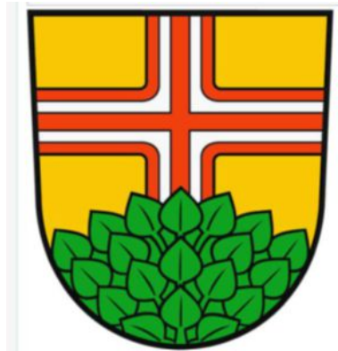
Afb. 2. Wapen van Kiekebusch, Ortsteil Schönefeld, Landkreis Dahme-Spreefeld.