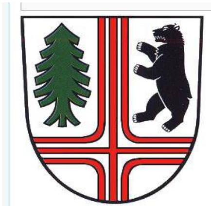
Afb. 1. Wapen van Hermsdorf, Thüringen.

In de wapens vinden we in zilver rep. goud een rood-gezoomd zilveren kruis, beladen met een rood versmald kruis.