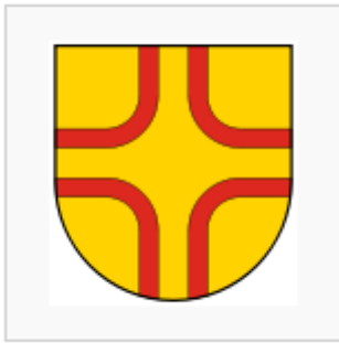
Afb. 6. Een gezoomd ívkereszt. of boogkruis.