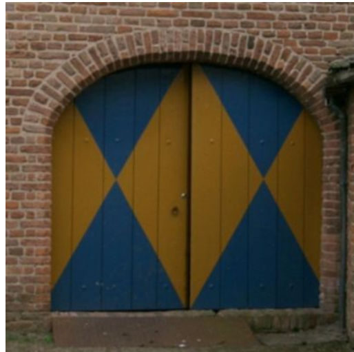
Afb. 3. Steunboog boven de voorburcht van Kasteel Doorwerth.