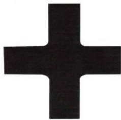
Afb. 5. Een kruis met afgeronde hoeken Computertekening NZH.

Verder zoekend op het trefwoord Stützbogenkreuz vond ik een website 4 in het Hongaars (ívkereszt = boog kruis) met drie afbeeldingen van boogkruisen 5 , waarvan ik er twee afbeeld (afb. 6 en 7).