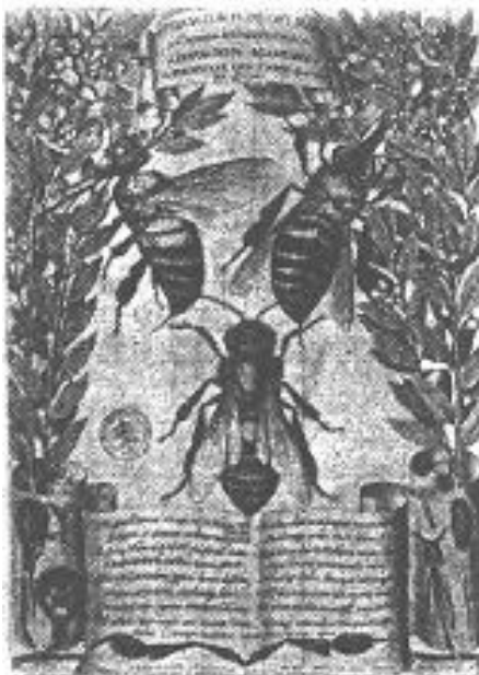
Afb. Het wapen van de Barberini-familie. (Zie Bronnen).