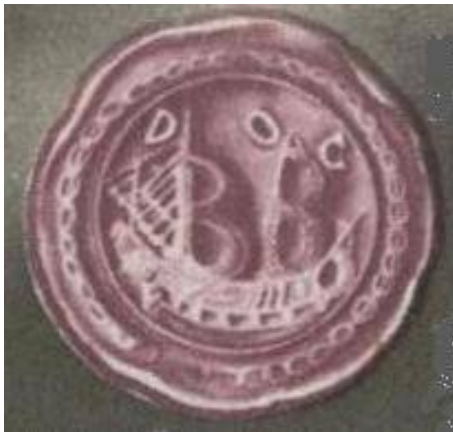
Fig. 7. De voorzijde van het zegel gebruikt in Cabo de Goede Hoop. Bron: postzegel van Zuid-Afrika uit 1948.

In 1714 wordt besloten dat voortaan ook in Cabo de Goede Hoop alle documenten met een eigen zegelstempel gezegeld dienden te worden 5 . Hiertoe gebruikte men een eigen zegelstempel, met een afbeelding van een driemaster en het omschrift CABO DE GOEDE HOOP. Helaas wordt dit zegel door Laing niet afgebeeld. Wel is op een Zuid-Afrikaanse postzegel een zegelafdruk van Kaap de Goede Hoop afgebeeld. DOC zal betekenen Directie Oost-Indische Compagnie Cabo de Goede Hoop. Er lijken primitief gesneden bolstaande zeilen te zijn gesneden. Indien dit het geval is, dan vaart het schip naar heraldisch links.