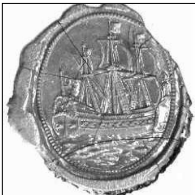
Fig. 8. De Bewindhebbers van d'Oost Ind.Comp. ten Kaamer Amsterdam. Amsterdam, 11 september 1764. Wageningen, Gemeente-archief, Oud-archief inv. nr. 99. Roodlak. Hoogte 2,6 cm, breedte 2.3cm 7 .

Een soortgelijk zegel wordt in het Gemeentearchief van Wageningen bewaard (fig. 8) 6 . Het werd in 1762 afgedrukt. Hierin is wel de driemaster te zien maar niet een omschrift. Aangezien er geen overzichtsartikel over de door de VOC gebruikte stempels gepubliceerd is kan niet nagegaan worden in hoeverre de bovengenoemde resoluties zijn uitgevoerd.