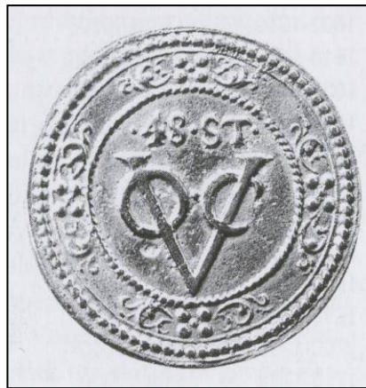
Fig. 4. De kroon, een 48 stuiver noodmunt gebruikt in Cabo de Goede Hoop.