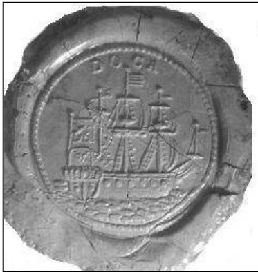
Fig. 9. Gemeentearchief, Oud-Archief inv. nr. 107. Afgedrukt te Amsterdam op 30 oktober 1797, Het 3 de Jaar Der Bat. Vrijheid , door P. De Neufville. Roodlak. Dsn. 2.9cm.

Een tweede zegelafdruk in het Gemeentearchief van Wageningen is van latere datum (fig. 9). De Neufville 6 bericht de Heuchelyke officieele tyding van het sluyten der Vrede tuschen de Fransche Republiek en den Keiser , die hij verstuurd aan zijn gewezene collega's in Wageningen. Hij gebruikte als zegel een stempel van de VOC. Boven de driemaster DOCA, dat is Directie Oost Indische Compagne Camer Amsterdam. Frankrijk is dan nog een republiek, terwijl de Keizer de keizer van Oostenrijk is.