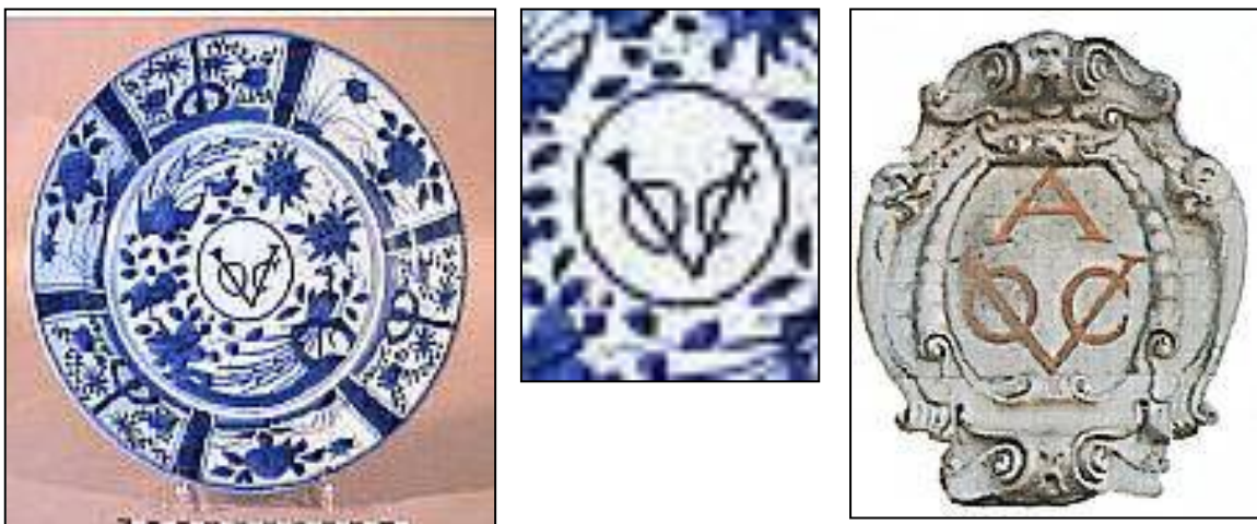
Fig. 1. Een bord, geproduceerd in Japan, einde 17 e eeuw (Fig. 1a: detail). Bron: www.museumkennis.nl/ waar het embleem het wapen wordt genoemd.

Het embleem (fig. 1) van de VOC is het meest voorkomende verwijzing naar de VOC. Door het aanbrengen van een letter tussen de poten van de V kon verwezen worden naar de plaats van herkomst. Zo verwijst de A in de gevelsteen naar Amsterdam (fig. 2) en de C in het zegel (fig 3) naar Cabo de Goede Hoop. In Oost-Indië werd het aangebracht o.m. op in Batavia geslagen noodmunten (fig. 4).