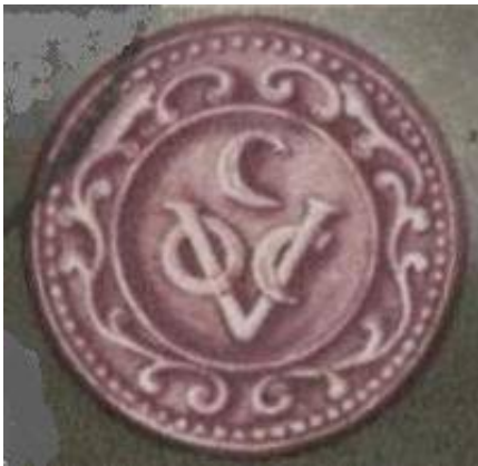
Fig. 3. De keerzijde van het zegel afdruk is niet aangegeven.

Fig. 2. Het embleem van de VOC-Kamer van Amsterdam [A] in een gevel in de Oostenburg te Amsterdam.