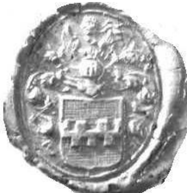
Afb. 3. Afdruk van het zegel van Doctor Frans Nicolaas Suermond, scholtis des ampts Rheden. Rheden 8-1-1758. Recht. archief inv. nr. 197. Foto 32.19.

Het feit dat hij een academisch titel voert duidt er op dat hij een universitaire studie heeft genoten. Zijn naam wordt niet door Schutte (1976) vermeld, zodat zijn universiteit aan mij niet bekend is.