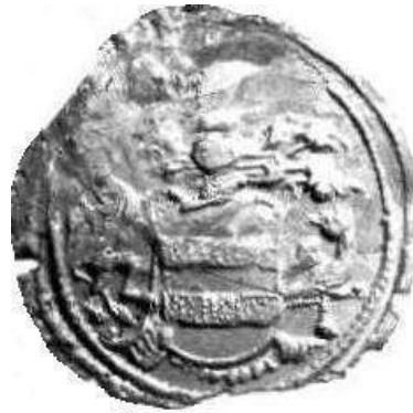
Afb. 10 Zegel van G. de Veer (ACZ 26.26).

Een tweede de Veer-zegel is dat van G. de Veer zien (Amsterdam, 16 augustus 1789, Oud-archief 109). De stippeling van de twee dwarsbalken duidt erop dat deze balken in een gekleurd wapen goudkleurig zijn. Het helmteken is onduidelijk. Heraldisch rechts van het schild houdt een (staande) griffioen het schild. Links van het schild komt een naar links kruipende, naar rechts omziende griffioen te voorschijn. De Veer schrijft 'Wij hebben ons vervoegd bij het Committé van Koophandel & Zeevaart der Stad Amsterdam -[het betreft] de benadeeling van ons Veer door de Muhlheimer Schippers --.' Mühlheim ligt in het Ruhrgebied. Kennelijk is onze zegelaar bij een veer betrokken en voer hij eveneens tussen Amsterdam en het Ruhrgebied. Wellicht heeft aan zijn beroep zijn achternaam te danken.