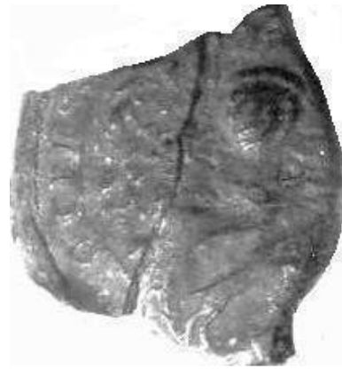
Afb. 2. Zegel van Johan Otters, scholtis des Ampts Ede, acte 1 (ACZ 11.10). Een voorbeeld van een beschadigd zegel.

Rechter zegel: rechtsonder ziet men een schild, beladen met twee verticale geplaatste achterpoten van de otter met daarboven zijn lichaam. Schilddekking: mogelijk een gekroonde helm.