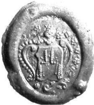
Afb. 3. Zegel wapentype 1, d.d. 13-2-1809 1-8-1805 (Recht. archief inv. nr. 222, ) foto 37.36