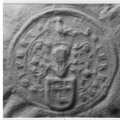
Afb. 2. Zegel van Jerephaes Heerl[ijck]h[eijd] inv. nr 80 foto augustus 1649. (Recht. Archief inv. nr. 131, foto 52.31).

In het algemeen zijn zegels ‘on gekleurd’; soms worden door middel van arcering en stippeling kleuren aangegeven. De beide zegels Foyert zijn ‘on gekleurd’ en daarom moeten wij voor de kleuren het Wapenboek van Sint Lucasbroederschap te Arnhem raadplegen (afb. 3). Leden van deze broederschap waren rechtskundigen. In dit wapenboek vinden we het wapen van Antonie Foyert, daterend uit 1649. 1