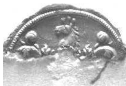
Afb.7 en 8. Derk R. van Bassenn, Arnhem 8 juli 1703 en 23 juni 1706 (ACZ 44.26 en 22.11)

bij de troebelen gedurende periode van de Oude en de Nieuwe Plooi (rond 1710). Hij ging zijn boekje ver te buiten en als straf werd hij uit Gelderland verbannen. Daarna woonde hij in Rhenen, een punt redelijk dichtbij Arnhem maar toch buiten Gelderland gelegen.