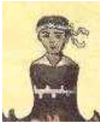
Afb. 1. Wapen Suermondts. Rechts het helmteken uitvergroot. Ontleend aan het CD-Wapenboek van de Vereniging Veluwe Geslachten.