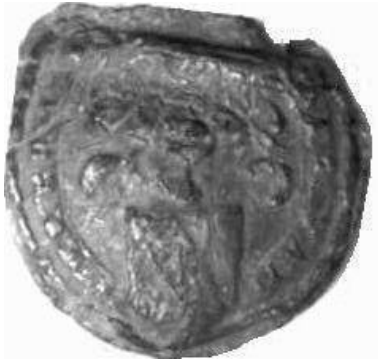
Afb. 5. Zegel van Maes van Kreel, custos van Bennekom en geërfde in Veluwe (ACZ 11.02).

slechts een brok resteert: drie vogels, waarvan de vogel linksboven omgewend) geven een machtiging af.