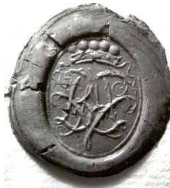
Afb. 5 en 6. Rijck van Staveren en Alida van Barnevelt. Wageningen, 31 mei 1759 (ACZ 35.01 en 35.02)