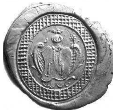
Afb. 4. Zegel wapentype 2, d.d. (Recht. archief inv. nr. 222, foto 38.01).

2-2. De bovenste twee halen staan in het midden dicht bijeen, en de onderste nabij de schildrand. Helmteken: een al of niet zwevend kroontje met drie fleurons. Zie (8) voor meerdere afbeeldingen.