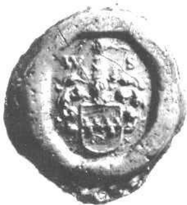
Afb. 6. Afdruk van het zegel van Willem Suermond. Wageningen, 6-7-1745. Recht. archief inv. nr. 220. Foto 37.12.

In het zegel van Willem Suermond (afb. 6) vinden we de linten van de hoofdband van het morenborstbeeld terug. Naast Barthold Suermond (afb. 2) is