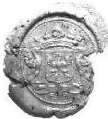
Afb. 4 Johan van Arnhem, 12 september 1689 (ACZ 03.05)