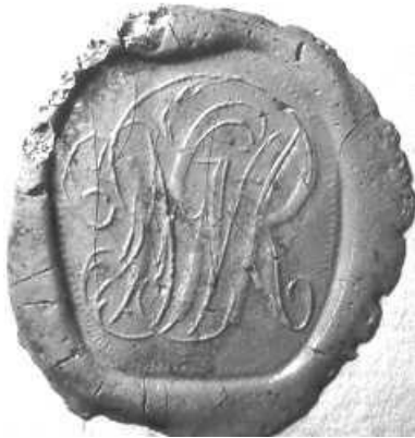
Afb. 1. Zegel mono 1, d.d. 28-7-1796 (Recht. archief inv. nr. 221, foto 35.38