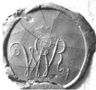
Afb. 2. Zegel mono 2., d.d. 23-2-1803) Recht. archief inv. nr. 221, foto 35.16).