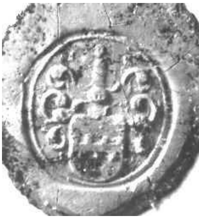
Afb. 5. Afdruk van het zegel van Peter Suermond. Wageningen, 4-4-1720. Oud-archief inv. nr. 1211. Foto 15.31.

In het GAW vond ik van Peter Suermond drie zegelafdrukken, waarvan één hiervan wordt afgebeeld (afb. 5). Deze drie zegels dateren uit 1719, 1720 en 1727. Ook bij hem is het morenborstbeeld verworpen. Zijn naam heb ik niet in de coll. Muschart gevonden.