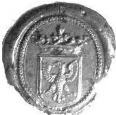
Afb. 3. Johan van Arnhem, Arnhem Arnhem 29 september 1676 (ACZ 20.02).

met drie fleurons (zegeltype 1, afb. 3) en een zegel eveneens beladen met een adelaar en met als schilddekking een kroon met drie fleurons, twee drie-parels en twee schildhouders: adelaars met opgeheven vlucht (het zegeltype 2, afb. 4). Johan van Arnhem behoorde tot de belangrijke Arnhemse familie. Hij bericht als Richter tot (=te) Arnhem en[de] Veluwezoom te Arnhem op 29 september 1676 over een Landdag te Zutphen (zegeltype 1), op 19 september 1684, dat het Gerigt zijn ‘ Gangt ’ op de Veluwezoom gaat maken en in Rheden begint (Oud-archief 80, zegeltype 2). Op 12 augustus 1689 kondigt hij een nieuwe rondgang aan, ook in Rheden te beginnen (Oud-archief 80, zegeltype 2). Volgens de CD-Wapenboek ‘Veluwse Geslachten’ was hij ook Heer van Rosendael.