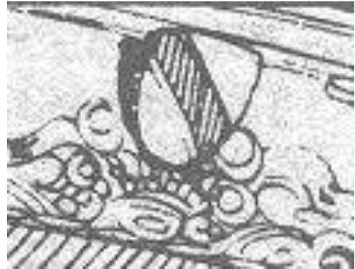
Afb. 3. Het wapen Bommel.