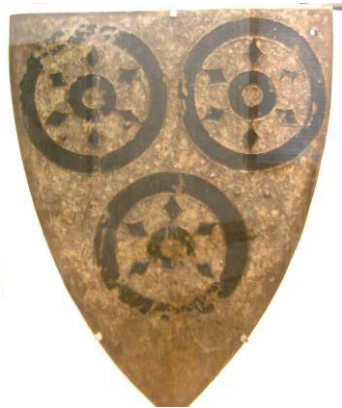
Schild van de Heren van Steinau, circa 1300.

De meeste schilden zijn 13 de en 14 de eeuws en door hun ouderdom en doordat zij eeuwenlang in de kerk hebben gehangen sterk beschadigd, waardoor het moeilijk is wapens op het schilden te zien. Sommige schilden hebben echter de tand des tijds goed doorstaan, zoals bijgaande afbeelding laat zien.