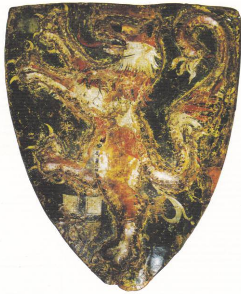
Abb. 58: Schild des Landgrafen Konrad von Thüringen, vor 1240 (Marburger Universitätsmuseum für Kunst- und Kulturgeschichte)