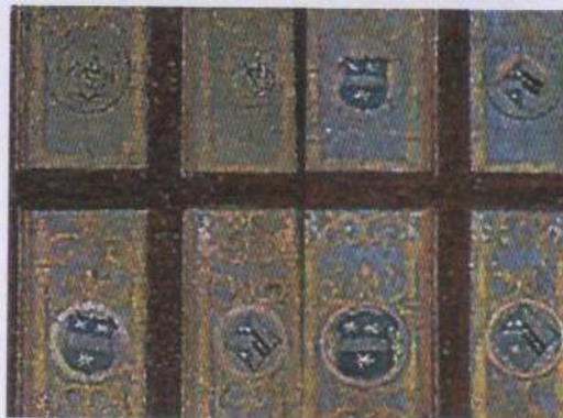
Boven: Het schilderij 'Maaltijd met de heren van Liere' uit 1523. Linksboven: Detail van het schilderij. De engel-schildhouder met de wapens van Liere lijkt slechts 'tijdelijk' te zijn opgehangen. Linksonder: Detail van de wapens in de glasramen links en rechts. De afgebeelde wapens schijnen geen uitstaans te hebben met aan de familie van Liere verwante families.