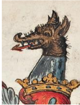
P 008 fol 112r -- Van Zuylen van Nyevelt ca 1565-1573. In zilver drie rode zuilen. Een half naar rechts gewende helm, gedekt door een gouden kroon, waaruit een half naar rechts gewende bruine drakenkop met zilveren halsbedekking en rode pijltong. Dekkleden: rood en zilver.