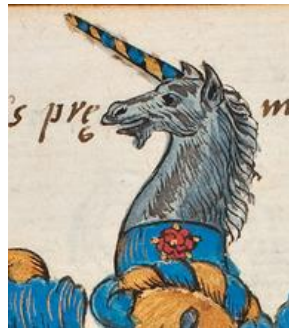
P 010 Adolphus Busleyden 1566 fol 054v Adolphus Busleyden. Gevierendeeld, 1 en 4. in blauw een gouden dwarsbalk, beneden vergezeld van een rode goudgeknopte en -gepunte roos, 2 en 3. in goud vijf zwarte wolfshaken met de ring omhoog (2-1-2). Helmteken: op een wrong van blauw en goud een uitkomende zilveren eenhoornkop met goud-blauwe hoorn en de onderzijde van de hals van blauw beladen met een roos van het schild. Dekkleden: goud en blauw. N.B. Deze? Adolf van Busleyden, heer van der Tommen, zv Nicolaas vB, tr. Philippote van Oyenbrugge, dv Philippe Rene vO en Jeanne d'Enghien. Hieruit 1. Adolf vB, burggraaf van Grimbergen, 2. Joanne.