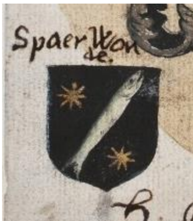
4. Van Spaerwoude: in zwart een schuinlinks geplaatste vis, rechtsboven en links beneden een gouden achtpuntige ster