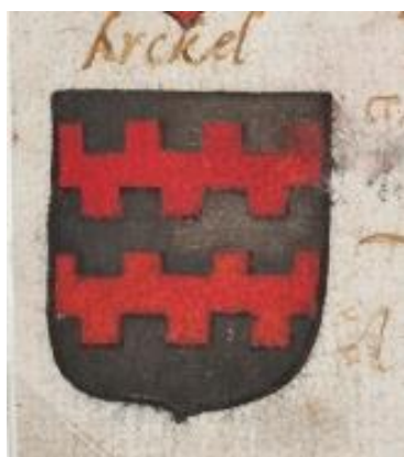
11. Van Arckel: in zilver twee rode beurtelings gekanteelde en tegengekanteelde balken.