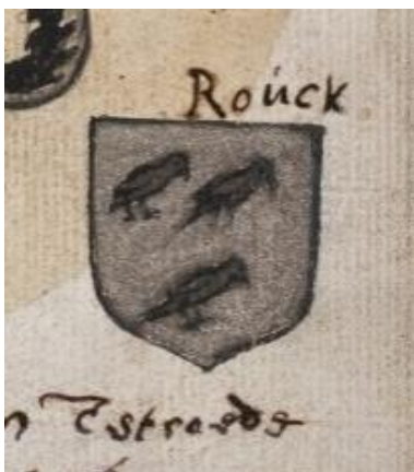
7. Rouck: in zilver drie omgewende zwarte vogels of roeken (2-1)