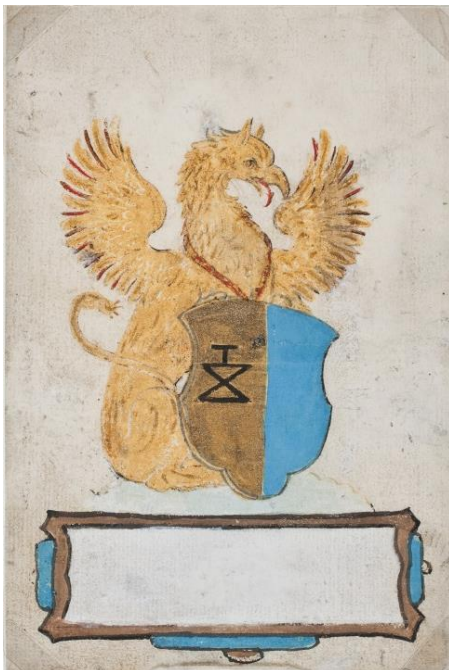
P 8 fol 16r N.N., s.l., tussen 1569-1596? Niet bij CBG, onbekend.

Dit wapen is identiek aan het wapen (De) Roo.