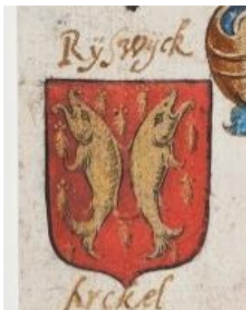
9. Van Rijswijck: in rood twee gouden afgewende zalmen, vergezeld van tien eveneens gouden hermelijnstaartjes (2-3-2-1-2). N.B. De hermelijnstaartjes moeten herkruiste Latijnse kruisjes zijn.