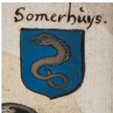
6. Somerhuys: in blauw een kronkelende zilveren paling.