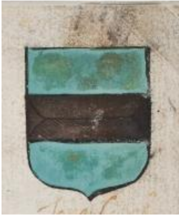
12. Ryswyck van der Werve, Zie boven. Het lijkt erop dat eerder het wapen Cobel was geschilderd.