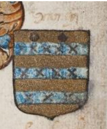
14. Gramay: in goud drie blauwe dwarsbalken, de bovenste beladen met vijf, de middelste met vier en de onderste met drie zwarte schuinkruisjes. In het schildhoofd twee zwarte Jacobsschelpen.

Zwart op blauw is heraldisch gezien ongebruikelijk.