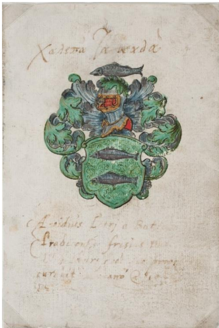
P 5. fol 015r Aegidius Petri, uit Friesland, Leuven, ?1571?

In groen twee zilveren vissen boven elkaar. Helmteken: op een zilveren en groene wrong de vis van het schild. Dekkleden: groen en zilver.