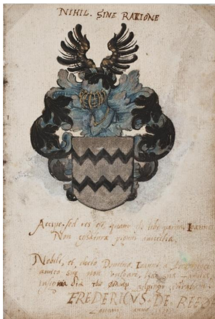
P 6 fol 010v Fredericus de Reede, Leuven, 1571.

In groen twee zilveren vissen boven elkaar. Helmteken: op een zilveren en groene wrong de vis van het schild. Dekkleden: groen en zilver.