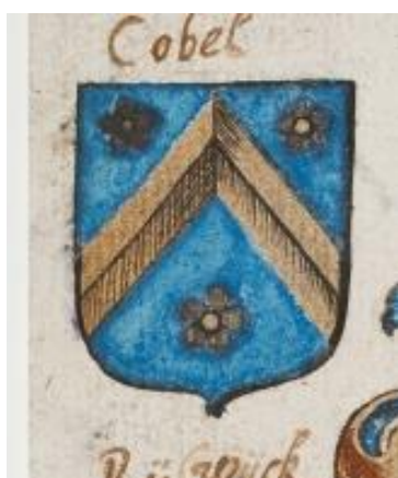
10. Cobel: in blauw een hoge gouden keper, vergezeld boven van twee en in de schildvoet van één zilveren roos.