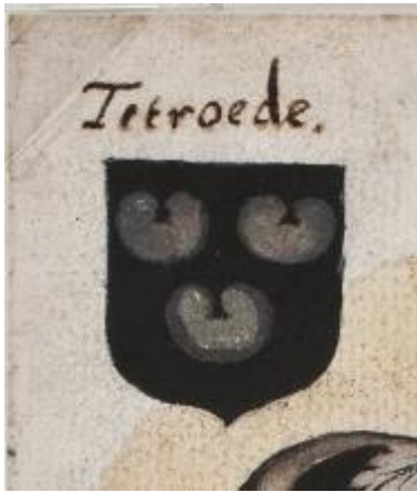
5. Van Tetroede: