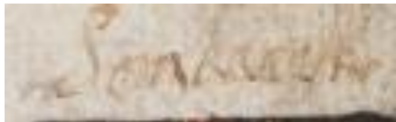
15. Sonkuyk: in goud drie rode kepers.

N.B. Deze naam kan ik op internet niet terugvinden.