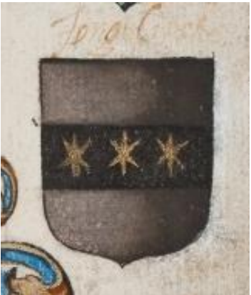
13. Jongelinck: in zilver een zwarte dwarsbalk, beladen met drie gouden sterren.