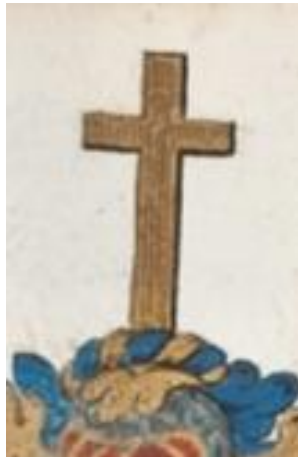
In blauw een groene grond, waarop schuingekruist een haas van natuurlijke kleur over een gouden kruis. Helmteken: op een gouden en blauwe wrong het kruis van het schild. Dekkleden: goud en blauw. Fugis quod times? etiam tolera.