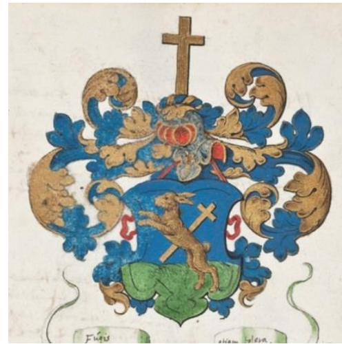
P 160 fol 061r Nicolaus Hasius (ca 1590-?), buitengewoon hoogleraar filosofie te Leiden, s.l. eerste kwartaal 17 de eeuw. Fol. 060v tekst.