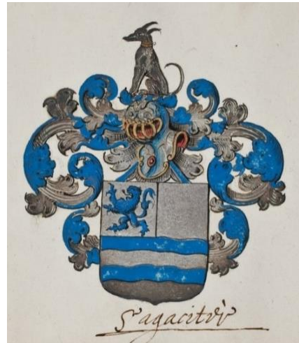
P 155 fol 107r Petrus Jacobi de Witte , Leiden eerste kwartaal 17 de eeuw.

Golvend doorsneden, A. gedeeld, 1. in zilver een blauwe leeuw, 2. effen zilver, B. drie golfbalken blauw, zilver en blauw; de schildvoet goud. Helmteken: op blauwe en zilveren wrong een zittende gouden gehalsbande zwarte? hond. Dekkleden: blauw en goud. S'agaciteu??