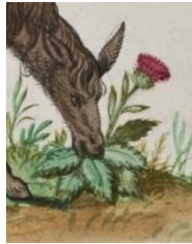
Welke plant is dit?