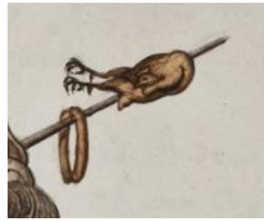
Een kippenbout en een worst.

P 154 fol 116r Gouache van Adriaan Hoffer. Fol 115v tekst