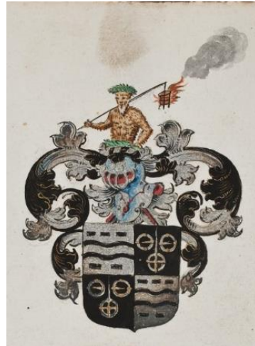
P 143 fol 044r Guilhelmus Muysdanus , Leiden 1608. Tekst fol 043v.

Gevierendeeld, 1 en 4. in zilver twee golvende dwarsbalken, vergezeld boven van drie liggende blokjes naast elkaar en beneden van twee iets grotere eveneens liggende blokjes naast elkaar; alles zwart, 2 en 3. in zwart een zilveren zwaard met gouden gevest, de punt omhoog, vergezeld van drie zilveren gespen (2-1), rechtsboven met de tong naar rechts en linksboven de tong naar links, de tong van de onderste gesp bedekt door het gevest van het zwaard. Helmteken: uit een zilveren en zwarte wrong een man uitkomend met blauwe gordel, goudkleurige kleding, en blauwe muts en houdende over zijn rechterschouder een stok waaraan een vlammeende en rokende vuurkorf hangt. Dekkleden: zwart en zilver.