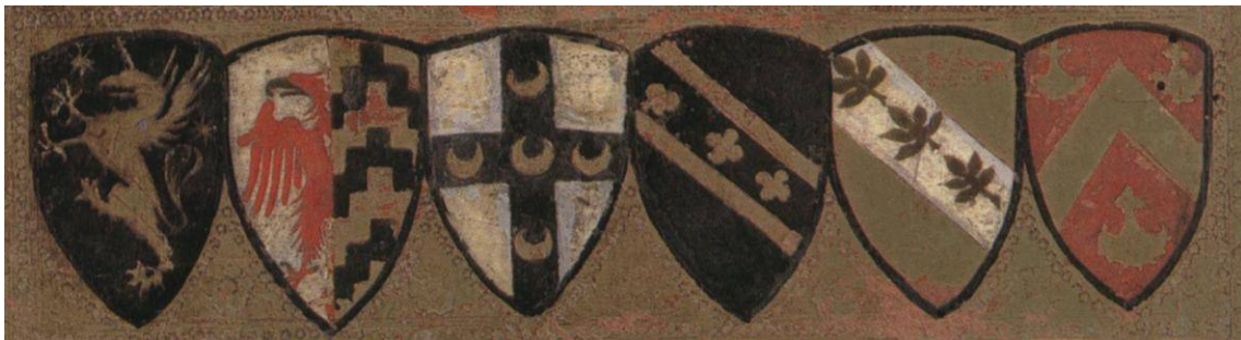
Afb. 2. De zes familiewapens van betrokken personen: Anastasi, onbekend, Piccolomini, Zondadari, Umidi en Arrighi.