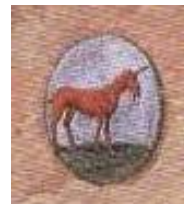
De Roode Eenhoorn