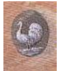
De Witte Pauw