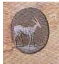
Het Witte Hert