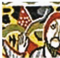
Afb. 2. De bloem