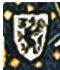
Afb. 3. Zie afbeelding 1 met als detail het schildje met de draak (sterke vergroting)