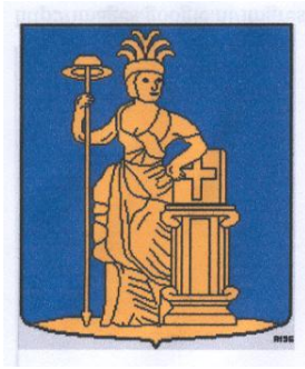
Afb. 3. Wapen van de gemeente Ede.