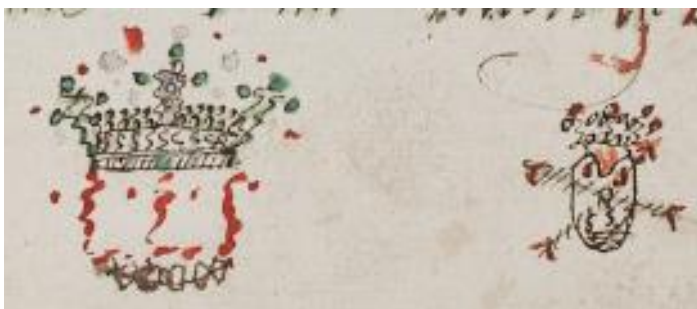
Schets van twee heraldisch-achtige gekroonde schilden, waarin een gezicht.