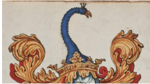
P065 fol 017: W.D.O. vanden Poll.

Doorsneden, A. in goud een uitkomende dubbelkoppige rode adelaar, B in rood drie palen van vair. Helmtteken: op een gouden kroon een naar links gewende blauwe pauwenkop met lange hals en gouden bek. Dekkleden: goud en rood.