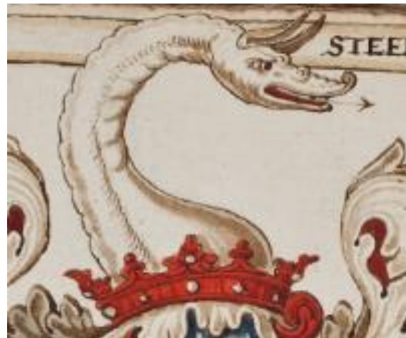
P 066 fol 133v: Godofroy de Steenhuyvs 1591.

In zilver een hoge keper vergezeld in de voet van een ring, alles rood. Helmtteken: op een rode kroon een zilveren drakenkop met hals en gouden hoorns en neus. Dekkleden: zilver en rood.