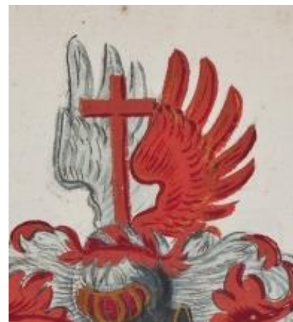
P 213 fol 006r: Pieck.

In zilver een rood kruis, waarvan de armen de schildrand raken. Helmteken: een zilver en rode antieke vlucht, ertussen een rood latijnskruis. Wrong en dekkleden: rood en zilver.