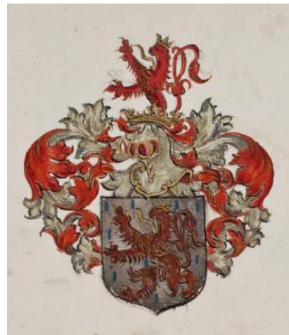
P 015 fol 079r: Johannes a Wijhe. Anno 1600 den leste Januarius [31 januari 1600]

In zilver, bezaaid met met acht blauwe blokjes, een rode leeuw, blauw getongd en genageld. Helmteken: op een gouden kroon de leeuw van het schild uitkomend. Dekkleden: rood en goud.