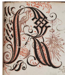
Voorbeeld van één van 19 initialen.