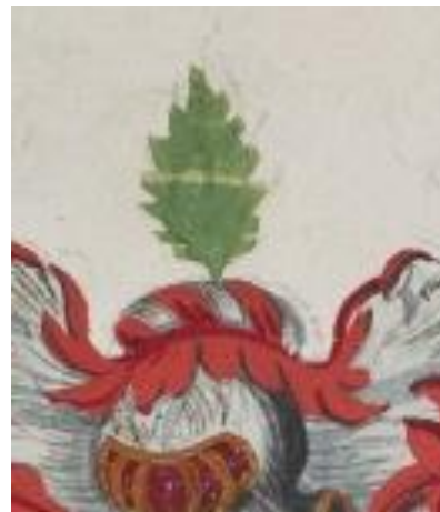
P 212 fol 007r: Von Weltzow.

Gedeeld. I. in rood een uit de deellijn komende naar rechts gewende zilveren ossenkop, II. in rood een uit de deellijn komende zilveren geweitak. Helmteken: een groen blad, beladen met een horizontaal geplaatste zilveren lint. Wrong en dekkleden: rood en zilver.