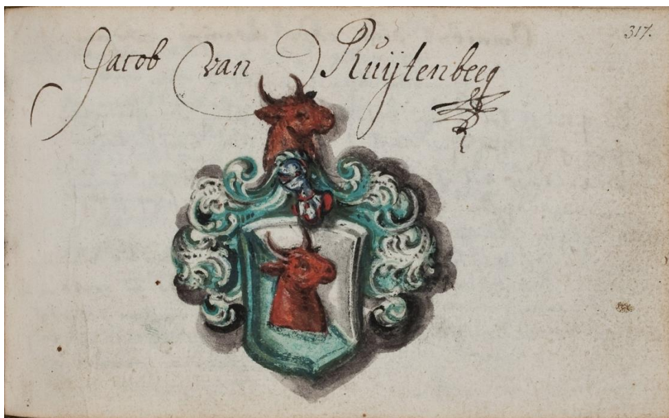
P 27 fol 317 Jacob van Ruijtenbeeck, [Friedrichstadt 1664].

Schuindoorsneden van zilver en blauw, overalleshien een rode omgewende ossenkop met hals. Helmteken: op een blauw en zilveren wrong de ossenkop van het schild. Dekkleden: zilver en blauw.