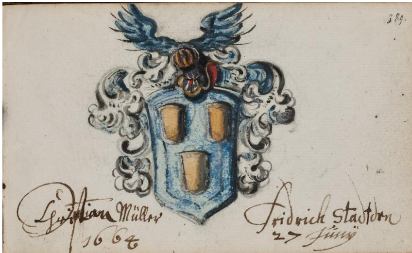
P 10 fol 389 Christian Müller , Friedrichstadt 27 juni 1664.

In blauw drie gouden kroezen? (2-1). Helmteken: een blauwe vlucht. Dekkleden: blauw en zilver.