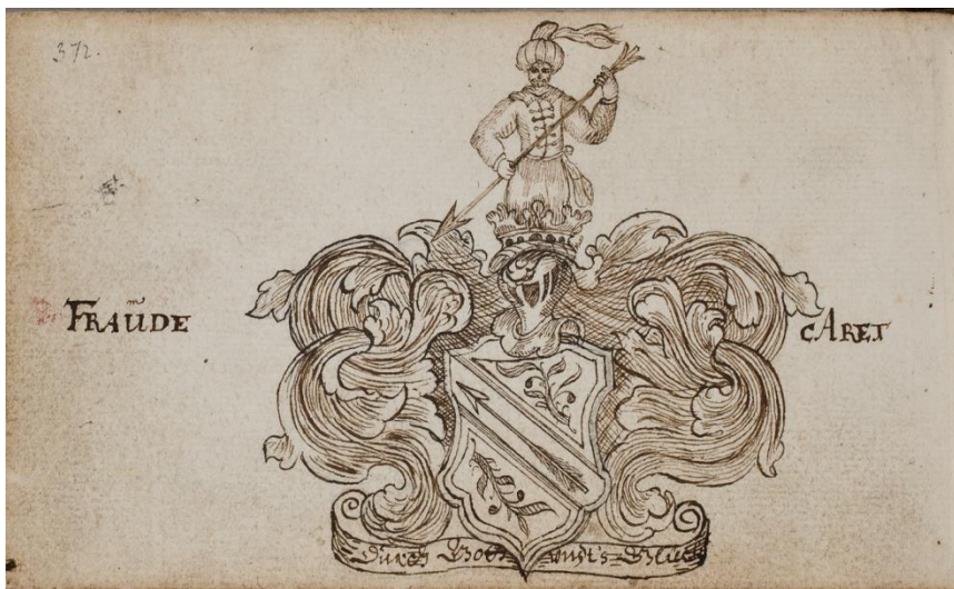
P 21 fol 372 Fraüde Aret. KB: Fridericus Artzatus. Friedrichstadt 25 juni 1664 KB: Fridericus Artzat

In blauw drie gouden kroezen? (2-1). Helmteken: een blauwe vlucht. Dekkleden: blauw en zilver.