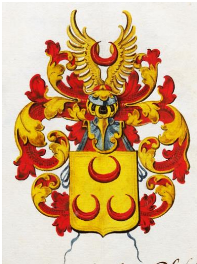
30 Theodorus Scharff