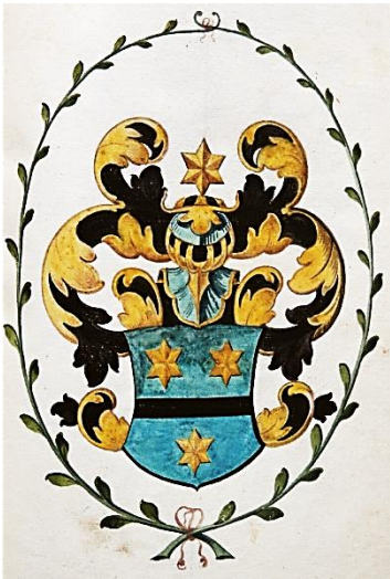
45 Egbertus Oostenbroek