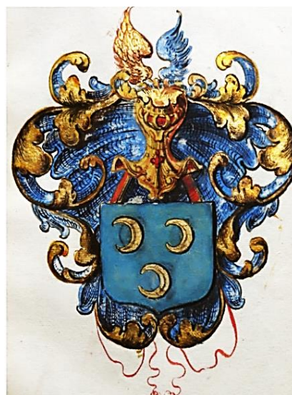
15 Eertwinus Gansneb dictus Tengenel