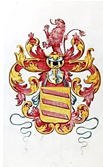
46 Hendricus Hoochstratensus