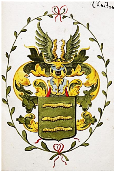
42 Wilhelmus Worm