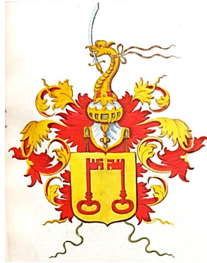
21 Ludovicus Wachtendorp