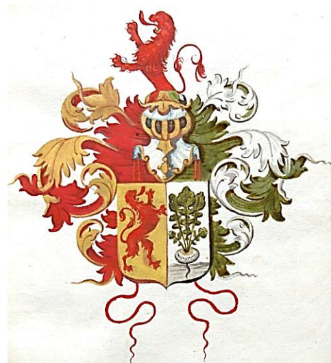
05 Henricus van Wageningen