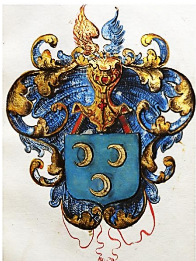
16 Alard Gansneb surnommé Tengenel