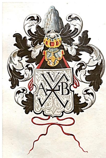
18 Arnoldus â Berchsom