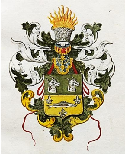
02 Hermannus Altius