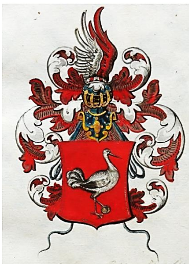
06 Nicolaus Guberleth