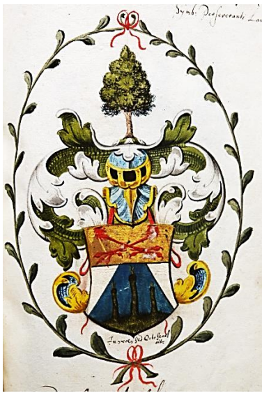
28 Wolterus Nyhoff