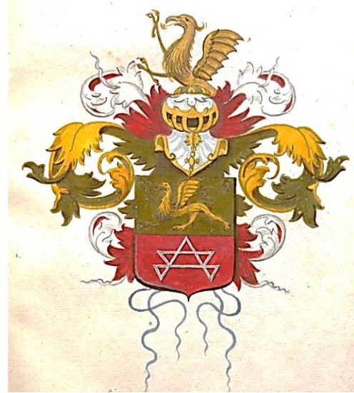
50 Rudolphus Kist