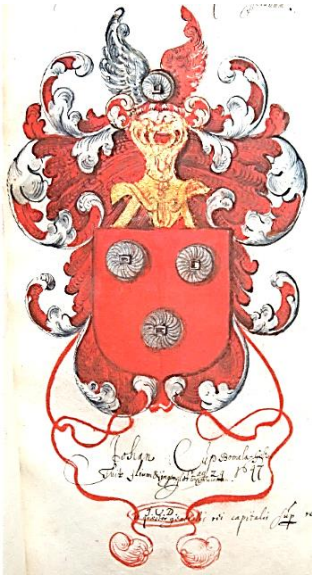
20 Johan Cup