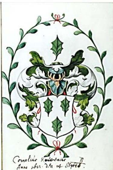
47 Cornelius Rouwenius