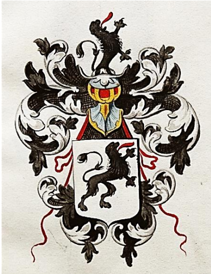
08 Laurentius Loefsen