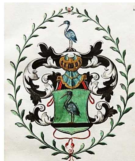
07 Wilhelmus Tichlerus