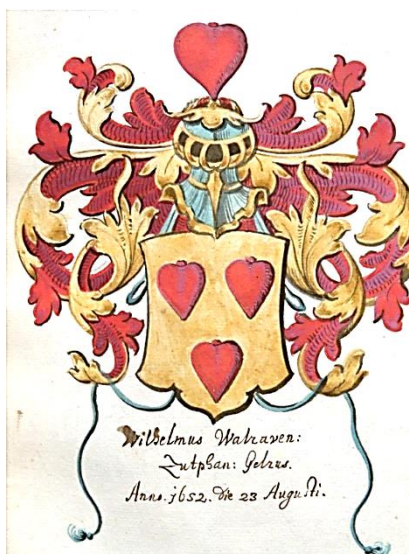
19 Wilhelmus Walraven