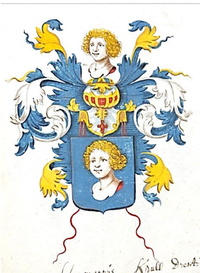
40 Hermannus Krull