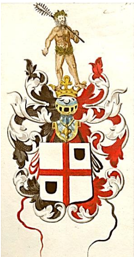
36 Conradus Singendonck