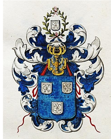
03 Joannes Gothofredis Carolinus