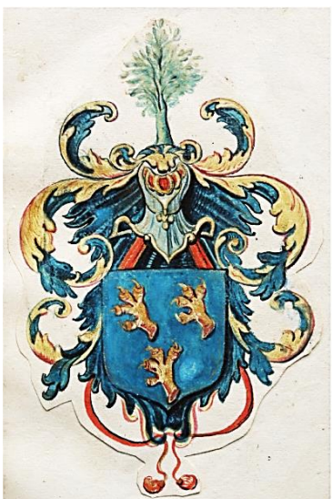
12 Gerhardus Kaldenbach