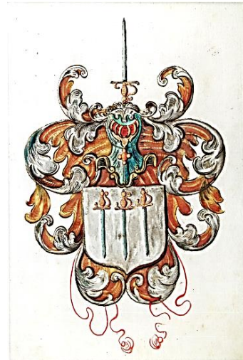
52 Eilardus à Duren