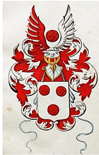
09 Everhardus Rouse