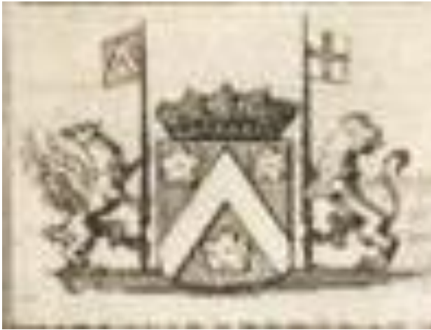
Afb. 5. Wapen van (Pierre) Ferdinand Roose, oomzegger en erfgenaam van Pieter Roose Door de sterk vergroting onscherp geworden.

omlijkende leeuw met een banier met een kruis. Het staat afgebeeld op een plaat van een buiten dat Ferdinand bewoond.