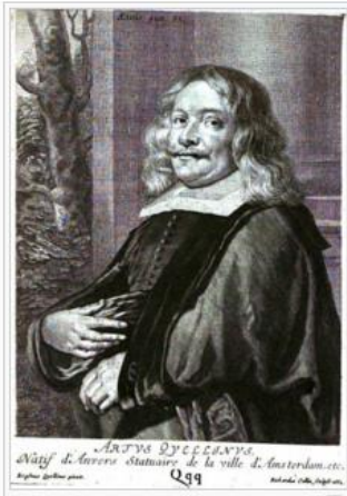
Afb. 4. Artus Quellinus de Oude (1609-1668) Portret naar een schilderij van Erasmus Quellinus (1662).

De beeldhouwer Artus Quellinus de Oude (afb. 4), ook wel Aerus Quellijn/Quellien genoemd, werkte voornamelijk in de Zuidelijke Nederlanden. In 1648 verhuist hij naar Amsterdam om aan de bouw van het nieuwe Raadhuis (het huidige Paleis op de Dam) mee te werken. Daarnaast was hij betrokken bij talloze kunstwerken, waaronder de windhond.