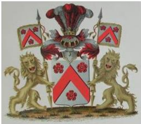
Afb. 5. Wapen de Rosen. Hollandse Genealogische Databank.

Een kleurenafbeelding van het wapen bevindt zich in de Hollandse Genealogische Databank, van Hans Nagtegaal. Het betreft een Limburgse familie de Rosen. in zilver een keper, vergezeld van drie gepunte rozen, alles rood. Helmdek: een gouden kroon, waaruit vijf struisveren komen rood-zilver-rood-zilver-rood. Dekkleden: rood en zilver. Schildhouders: twee aanzienende gouden leeuwen, roodgetongd, houdende een gouden tournooilans met een banier volgens het schild. iii