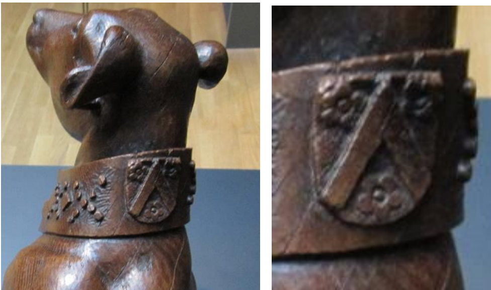
Afb. 2 en 3. Details van het beeld.