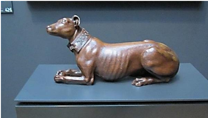
Afb. 1. De windhond (Rijksmuseum, Amsterdam)

Een vervolg op mijn drie artikelen over heraldische halsbanden van honden i is de beschrijving van de heraldieke halsband van een hond in het Rijksmuseum te Amsterdam (afb. 1). Deze eikenhouten windhond werd door Artus Quellinus de Oude (Antwerpen 30 aug. 1609- Antwerpen 23 feb. 1668) in 1657 gesneden. De vitrine staat tegen de muur en daardoor is aan de bezoekerszijde niet te zien dat op de achterzijde van de halsband zich een wapen bevindt. Dit wapen is van de regentenfamilie Roose te Antwerpen (afb. 2 en 3). Op de website van het Rijksmuseum is te lezen, dat deze hond waarschijnlijk voor de Antwerpenaar Pieter Roose (1586-1673) werd gemaakt ii . Doordat Pieter in hogere kringen van de Spaanse Nederlanden verkeerde zal hij meestal van de naam Pierre gebruik hebben gemaakt.