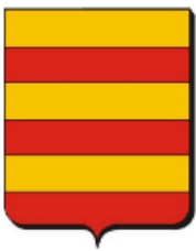
Van Rijn.

De afbeelding in de Heraldische Databank van het Centraal Bureau voor Genealogie: Van Rijn: gedwarsbalkt van zes stukken, goud en rood.