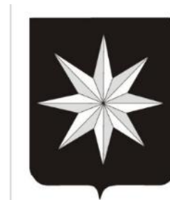
Coll. CBG HDATNL018367

Gherit Van der Wateringe: een achtpuntige ster, in het schildhoofd een barensteel met vier hangers. Omschrift: S . GERARDI:DE.WATER—E. MIL TIS