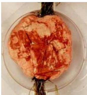
Zegel van koning Abel van Denemarken en hertog van Jutland. Regest 1. 24 september 1251, Abel, Danorum Slavorumque rex, dux Jutie. Een sterk beschadigd troonzegel. SaK-Kampen.

Kees Schilder beschrijft dit zegel: gemaakt van witte was met een donkere patina. Op de breukvlakken zijn korreltjes van een rode stof zichtbaar. Deze zijn door de witte was gemengd. Deze rode “stofdeeltjes” kunnen van minium zijn geweest.