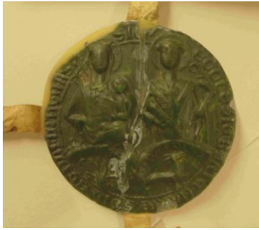
Zegel van Sint Aegidii-klooster.

Het zegel wordt beschreven als groengelakt. De foto toont ons dat de groene lak gele/maagdelijke was dekt. (14)