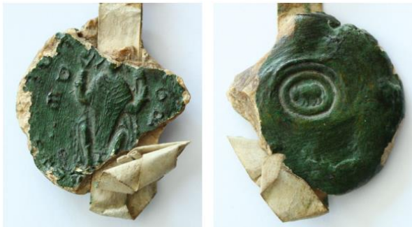
Zegel van Hugues d'Amiens, 1161. AD 76 26 Hp 75. Links voor penseelstreken. (13)

Een groen gelakte afdruk, meldt Jacquet. Het werd in 1161 afgedrukt en misschien in hetzelfde jaar gelakt.