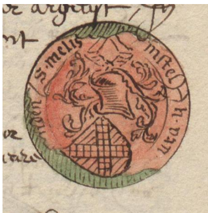
Een tekening van het zegel van Melis van Amstel, ridder, 1453. Buchelius Band 6 blz 174.

Het wapen van Melis van Amstel/van Aemstel is gedwarsbalkt van 8 stukken, goud en zwart, over alles heen een schuinkruis, geschaakt in twee rijen van rood en zilver (CBG). Schilddekking: een helm, helmdekking: twee armen met de ellebogen naar buiten gebogen, de bovenarmen gekleed en de handen gevouwen. Omschrift: S.MELIS AEMSTEL H.VAN [?CRONENBURCH EN]- MIJNDEN. Buchelius schreef erbij: