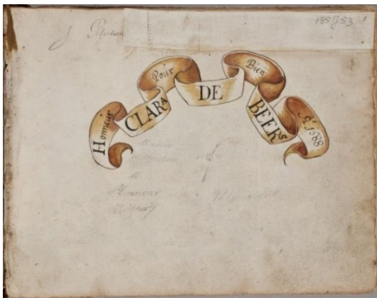
P 216 fol 001r: eigendomsmerk Amoreuse Honneur pour bien = eer boven bezit Volgens internet: respect voor het goede.

Beers 2, Bekendorp 9, Berchem 9, Bers 4, Bocholt 7, Donq 8, Gerwen 5, Granon 7, Isselstein 6, Kessel 11, Merwijck 12, Palts Beieren 12, Pieck 10, Poll 3, 6, Steenhuis 3, Valckenaer 5, VamZee 8, Voerd/Voort 4, Weltzow 10, Wijhe 2, Zulow 11 + embleem van Elizabeth I, koningin van Engekand.