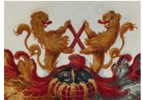
P14 fol 19r Johan (Philips?) van der Wiele , Rome 27 februari 1610

Gevierendeeld, 1 en 4. in goud drie rode en blauwe vaarpalen naast elkaar, en een gouden schildhoofd beladen met een verkort rood schuinkruis met ingesneden einden, 2 en 3. in groen een zilveren dwarsbalk. Helmteken: twee uitkomende toegewende gouden roodgetongde leeuwen, samen houdend in de voorklauwen een rood schuinkruis. Dekkleden: rechts: rood en goud, links: zilver en rood.