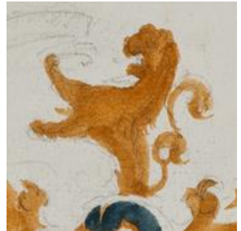
P 23 fol 030r wapen in potlood en penseel

Beschrijving van de schets: in goud een nog ongekleurde keper, vergezeld rechts- en linksboven van een leeuwenkop met hals. Helm: zwart, dus waarschijnlijk oorspronkelijk zilver. Helmteken: een uitkomende leeuw. De tong en nagels anders gekleurd en daarom nog niet getekend. Dekkleden: misschien goud en mogelijk blauw of groen?