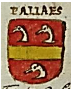
Wapen van Floris van Pallaes

Een schildzegel is een heraldische zegel, dus met een wapenschild. In later geschilderde wapens is het zwemmend vogeltje op de balk verdwenen. Misschien was dit vogeltje een breuk, dat wil zeggen zijn persoonlijke toevoeging om zich te kunnen onderscheiden van andere (Herbert) van Pallaes-naamdragers.